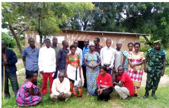
Local leaders and member of FARDC (Congo national army) after a training on guidelines and safe schools' declaration at Kiliba, South-Kivu

populations et ont facilité la transmission des lignes directrices sur la protection des écoles et de la sécurité. Déclaration des écoles.