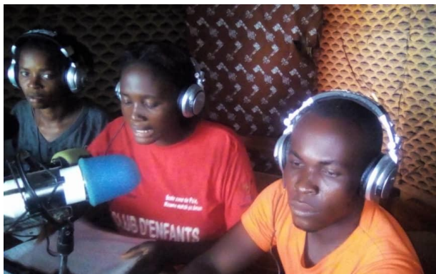
SZOP Protection monitor presenting radio program at Luvungi, South-Kivu.

Les radios sont l'un des principaux outils de communication de masse utilisés pour la communication entre les communautés de la province du Sud-Kivu en RD Congo. Avec une population totale estimée à cent mille personnes vivant dans les territoires d'Uvira et de Fizi, la sensibilisation par la radio a permis de toucher l'ensemble de la population vivant dans la zone d'exécution, ce qui a eu un impact important sur leur engagement à protéger les écoles locales contre les