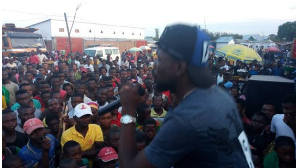
Local artist performing SZOP song on schools' protection a mass campaign in Baraka, South-Kivu.

Afin d'atteindre pour les membres des communautés ciblées, d'interagir avec eux et vulgariser les lignes directrices pour la protection des écoles et la déclaration des écoles sécuritaires, plusieurs campagnes publiques ont été menées.